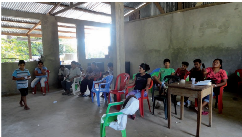
Población de Arazaire. Reunión comunal, abril de 2013

El reto que tiene Arazaire es plantear un equilibrio entre la práctica de la minería, cuidar el medio ambiente (recuperación ambiental de su territorio, mitigación de impactos por minería) y la salud de las familias indígenas.