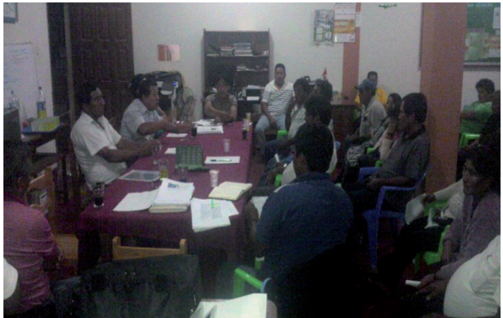
Reunión de FEDEMÍN y bases mineras afiliadas, el 21 de mayo de 2013, a raíz de las acciones de interdicción en Madre de Dios