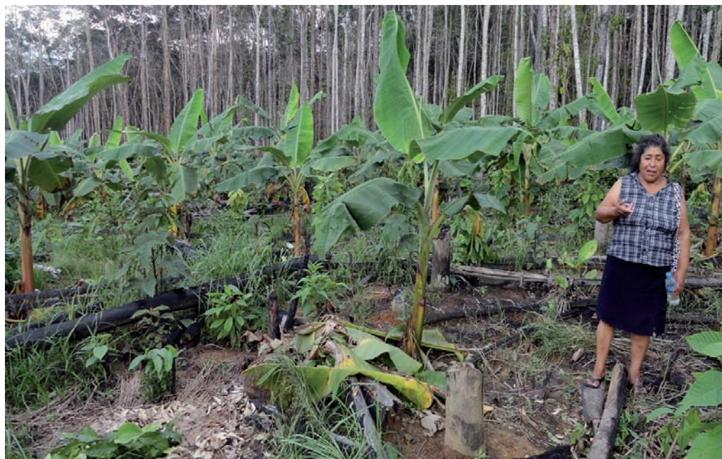
Gavina Quispe Solórzano, líder de Unión Progreso mostrando sectores de su predio agrícola. Abril de 2013

Asimismo, la población de Unión Progreso no conoce la situación actual sobre la vigencia de los derechos de concesiones (forestales maderables o no maderables y/o de ecoturismo) que se encuentran colindantes a sus predios agrícolas, y es una de las razones por las que ocurren invasiones continuas.