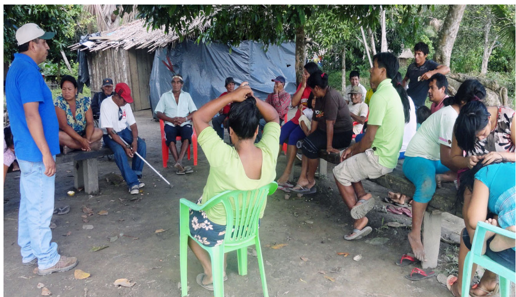
Población de Boca del Inambari. Reunión comunal, junio de 2013

En junio, la población de Boca del Inambari evaluó la idea de revocar a su presidente comunal y denunciarlo ante la FENAMAD por incumplimiento y abuso de funciones, ya que refieren que su gestión de la comunidad no es la más adecuada (no cumple con las asambleas comunales obligatorias mensuales y no existe transparencia en el manejo económico de la comunidad).