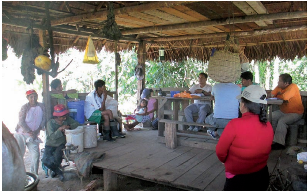
Población de San Juan en reunión comunal. Mayo de 2013