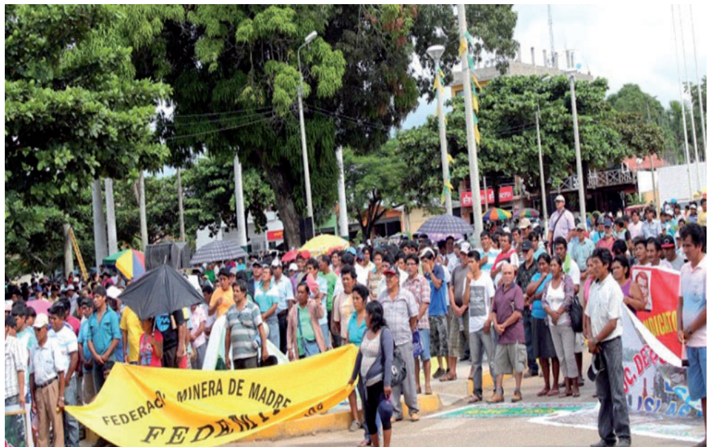
Paro minero del 30 de mayo de 2013, en Puerto Maldonado