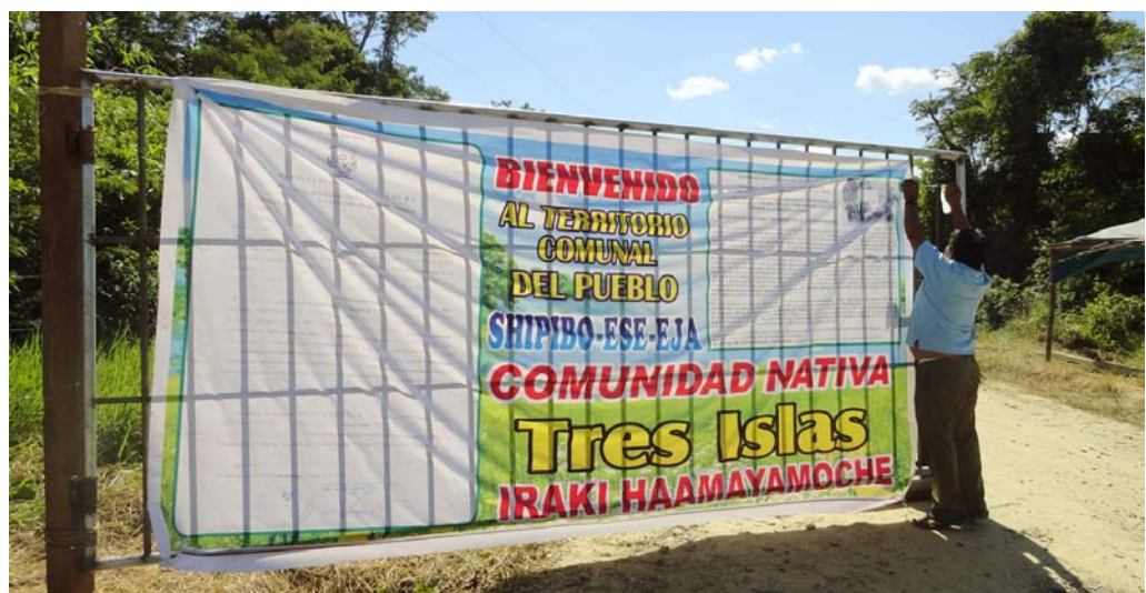
Tranquera colocada por la comunidad de Tres Islas. Mayo de 2013

Lamentablemente, ningún representante del Poder Judicial asistió a la audiencia para explicar las razones por las que no ejecutan la sentencia. En esta audiencia instituciones como la Defensoría del Pueblo, Registros Públicos, Dirección Regional de Educación, Gobierno Regional, Policía Nacional del Perú expusieron la labor que realizan en coordinación con las comunidades nativas. En esta sesión se decidió realizar una tercera audiencia pública en el mes de octubre.