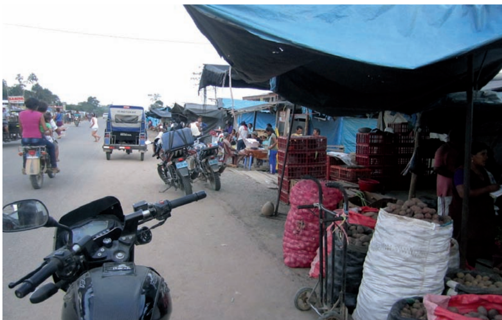
Centro de abastecimiento de insumos en el eje carretero kilómetro 108 de la carretera interoceánica Puerto Maldonado-cusco, abril de 2013

Otro hecho significativo fue que el 06 de mayo, el presidente de esta asociación, atedió una denuncia de una invasión de un predio agrícola por parte de mineros. En la diligencia, el presidente de la asociación recibió disparos de arma y fue intimidado a continuar con su diligencia. Él no ha realizado denuncias porque no confía en las autoridades policiales locales.