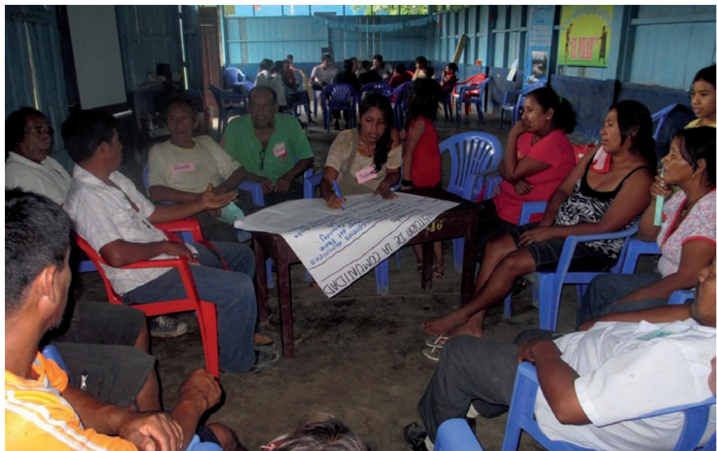
Población de El Pilar, reunión comunal, abril de 2013

En los últimos tres meses, algunos indígenas de El Pilar han comenzado a trabajar minería con técnicas muy rudimentarias en las inmediaciones del río Madre de Dios. La práctica de la minería se realiza con autorización de la Junta Directiva y los ingresos son para las familias involucradas y un pequeño porcentaje para la comunidad. El desafío que se plantea de esta comunidad es tratar de definir quiénes practicarán minería en su territorio para que puedan iniciar su proceso de formalización.