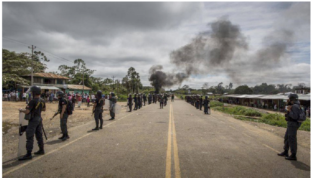
Paro minero en la ciudad de Laberinto, setiembre 2013