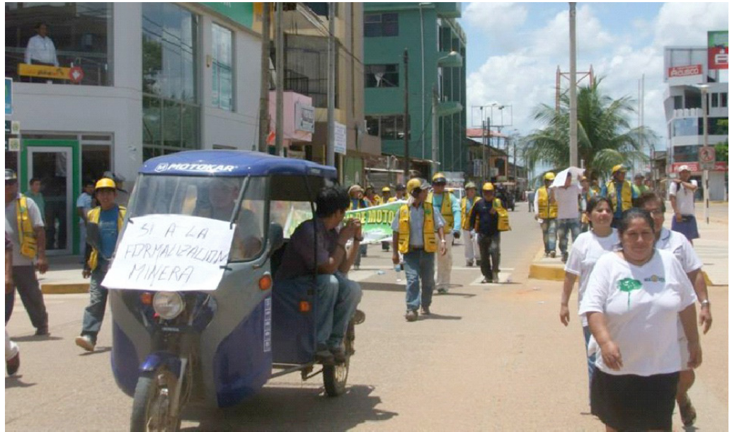
Mineros, transportistas y abastecedores de insumos marchan por ciudad de Puerto Maldonado en protesta por las interdicciones que realiza el Estado en la región. Setiembre 2013