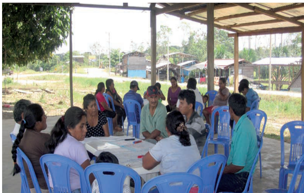
En la fotografía: población de Unión Progreso en talleres de elaboración de Planes de Vida, julio 2013

De otro lado, la población de Unión Progreso está integrada por 5 asociaciones de agricultores ubicadas en las inmediaciones de la carretera interoceánica. Una de estas asociaciones comenzó a cobrar peaje provocando conflictos entre las líneas de transporte público y los pobladores de Unión Progreso. El Ministerio de Transporte y Comunicaciones señaló mediante una carta que la población de Unión Progreso no tiene autorización para el cobro de peaje.