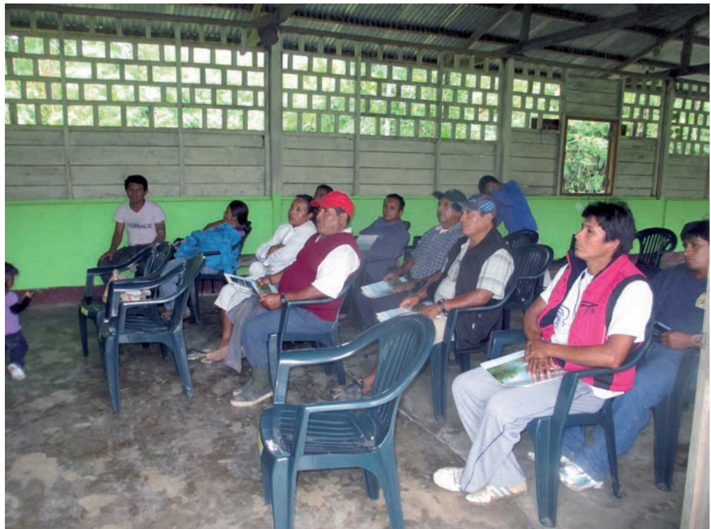
En la fotografía: Población de San Jacinto en taller integrado sobre minería en pequeña escala, gestión empresarial y acuerdos previos, agosto 2013

En el mes de setiembre, la población de la comunidad demanda mayor organización de la junta directiva comunal y establecer reuniones para dialogar sobre los acuerdos verbales para explotar oro entre la comunidad y mineros.