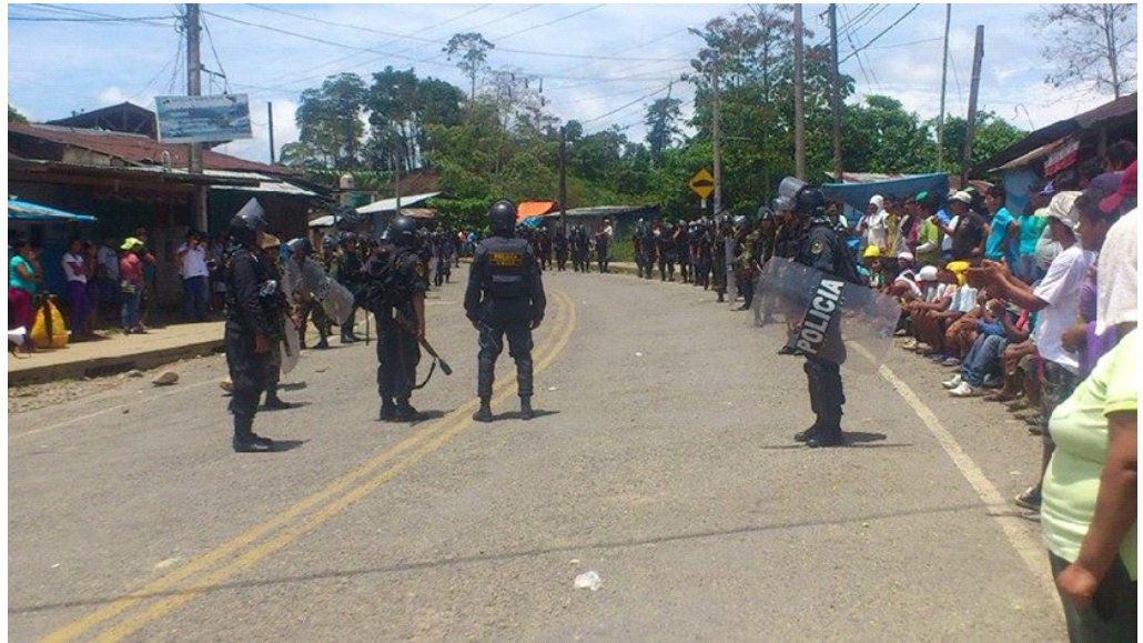
Paro minero en la ciudad de Mazuco, setiembre 2013