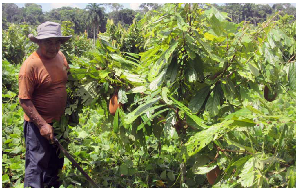
En la fotografía: poblador de San Juan en su predio agrícola, agosto 2013

En setiembre, la demanda más importante de la población de San Juan es gestionar la titulación de sus predios agrícolas.