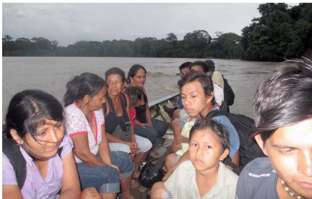
En la fotografía: población de la comunidad de El Pilar, agosto 2013

La junta directiva continua promoviendo que la población de la comunidad construya viviendas en su territorio, en un proceso de repoblamiento de los márgenes derecho e izquierdo del río Madre de Dios.