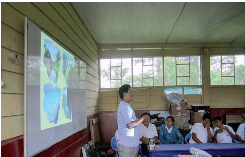
En la fotografía: taller sobre recursos naturales en Sarayacu, agosto 2013

Asimismo, mantienen su rechazo a trabajar con instituciones privadas y/o humanitarias.