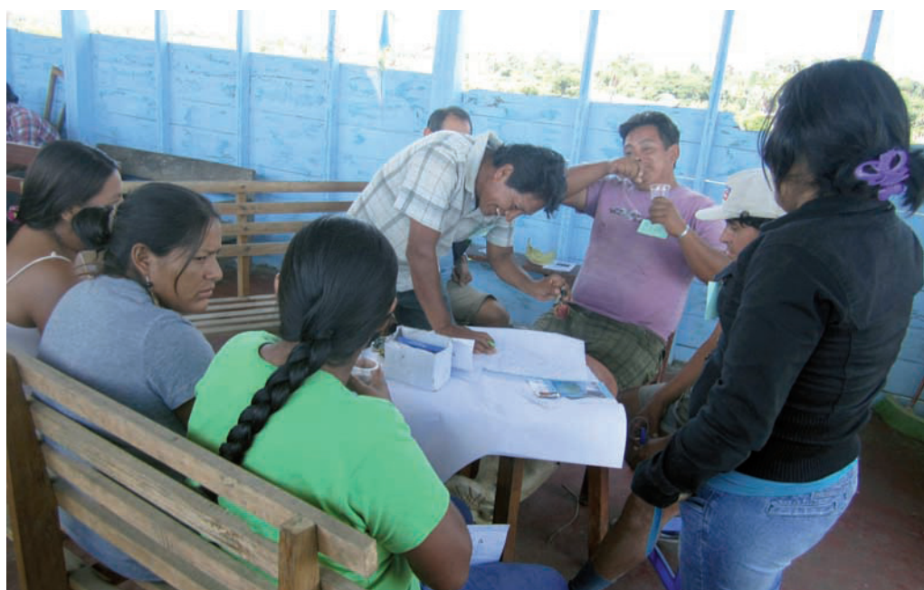
En la fotografía: población de Nueva Arequipa en taller de elaboración de Plan de Vida, julio 2013

El 25 de setiembre la PNP inició un nuevo operativo de interdicción contra la minería ilegal con la participación de aproximadamente 400 efectivos policiales. Estas acciones de interdicción duraron 5 días, sólo en el primer día se lograron destruir 38 motores, 27 tolvas, 950 metros de manguera de 4 pulgadas, 23 balsas tracas y 11 chupaderas. También se decomisaron 18 cilindros de combustible (petróleo).