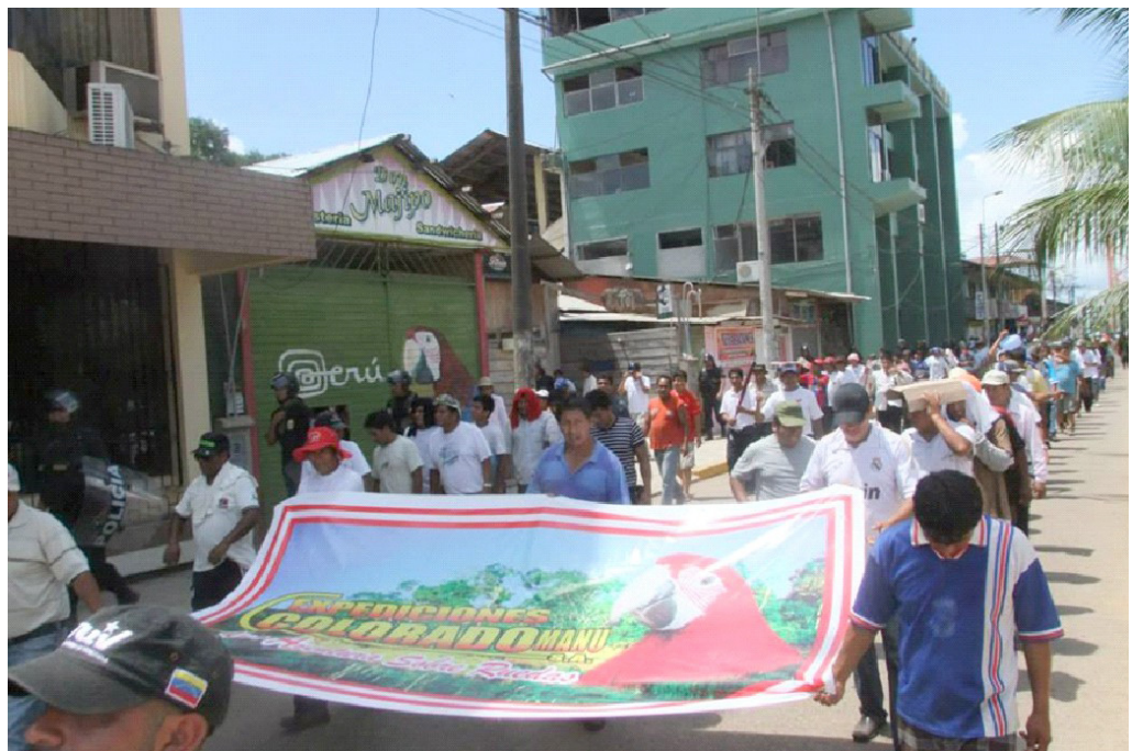
Mineros, transportistas y abastecedores de insumos marchan por ciudad de Puerto Maldonado en protesta por las interdicciones que realiza el Estado en la región. Setiembre 2013

Esta última movilización se resolvió tras continuas reuniones entre la PCM y la CONAMI. Los acuerdos fueron: a) ratificar la decisión conjunta de los gremios mineros en procesos de formalización (todos los que han presentado su declaración de compromiso) a los cuales el Estado brindará las garantías legales y administrativas para que los mineros artesanales y pequeños productores mineros culminen este proceso; b) gremios mineros y Estado se comprometen a revisar las estrategias y la normativa existente con la finalidad de identificar los obstáculos que dificultan el acceso a los contratos de explotación; c) el Estado se compromete a generar las condiciones para que las entidades públicas y privadas realicen los estudios técnicos y científicos para determinar las áreas deforestadas e índices de mercurio en los habitantes y las fuentes de agua de Huánuco, Madre de Dios y Ucayali; d) precisar que las acciones de interdicción continuarán en todo el país, en zonas no autorizadas según lo establecido en el Decreto Legislativo N° 1099-PCM; e) los mineros artesanales y pequeños mineros continuarán realizando sus actividades, cumpliendo con lo establecido por el TÚO de la Ley de Minería aprobado por el D.S 014-92- EM y la Ley N° 27651 de promoción y formalización de la pequeña minería y minería artesanal.